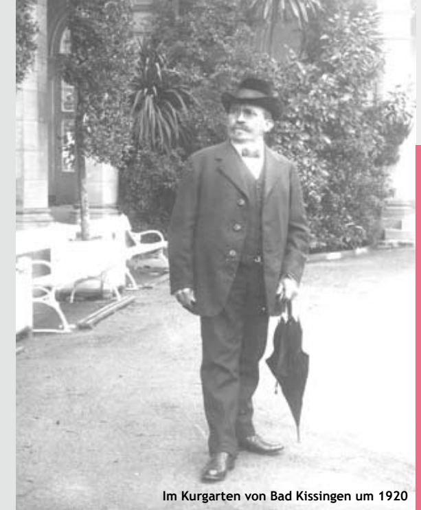
Im Kurgarten von Bad Kissingen um 1920