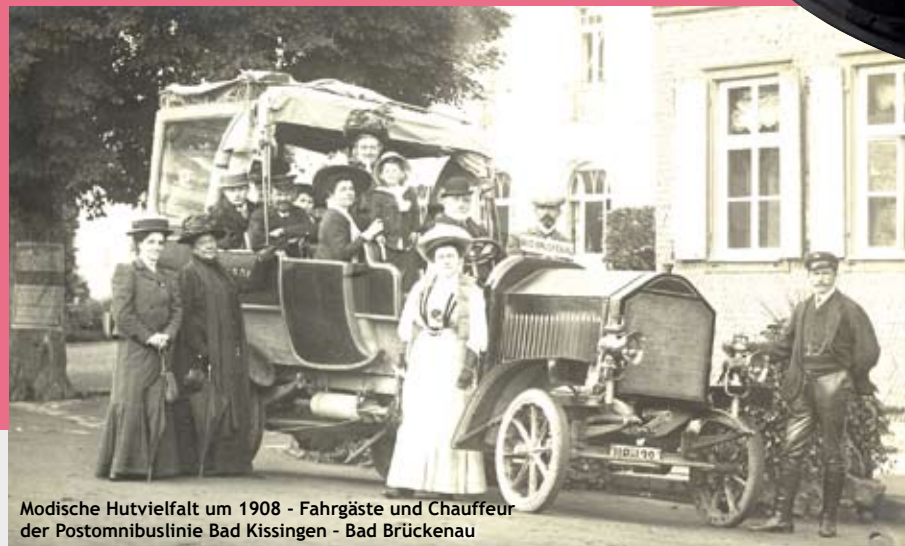
Modische Hutvielfalt um 1908 - Fahrgäste und Chauffeur der Postomnibuslinie Bad Kissingen - Bad Brückenau

Die Sonderausstellung: „Hüte. Hüte“ bietet Einblicke in die Geschichte der Kopfbedeckungen aus der Zeit um 1800 bis um 1960. Anhand ausgewählter Beispiele zeigt sie die ganze Bandbreite männlicher und weiblicher Kopfbedeckungen als Dokumentation eines nicht unwesentlichen Teiles der Bekleidungs-geschichte in Unterfranken. Eine Sonderstellung nehmen dabei die vielfältigen Trachten- und Uniform-kopfbedeckungen ein. Darüber hinaus thematisiert die Sonderschau die aufwändige Herstellung von Hüten durch das Hutmacher- und Modistinnenhandwerk sowie das Spektrum der Bad Kissinger Hut-geschäfte.