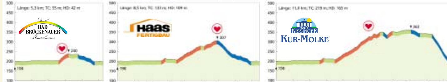
Nordic Walking Streckenprofil: TC = Gesamthöhenmeter · HD = Höhendifferenz (höchster zu niedrigster Punkt der Strecke)