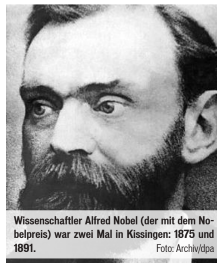
Wissenschaftler Alfred Nobel (der mit dem Nobelpreis) war zwei Mal in Kissingen: 1875 und 1891.