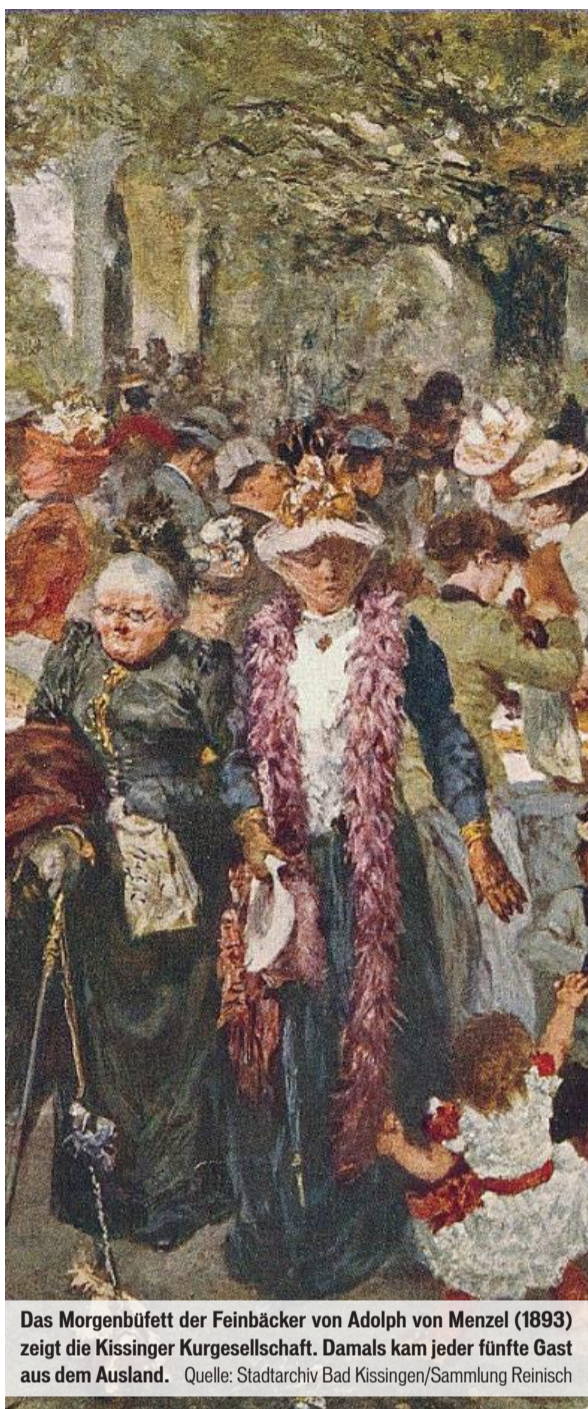
Das Morgenbüfett der Feinbäcker von Adolph von Menzel (1893) zeigt die Kissinger Kurgesellschaft. Damals kam jeder fünfte Gast aus dem Ausland.