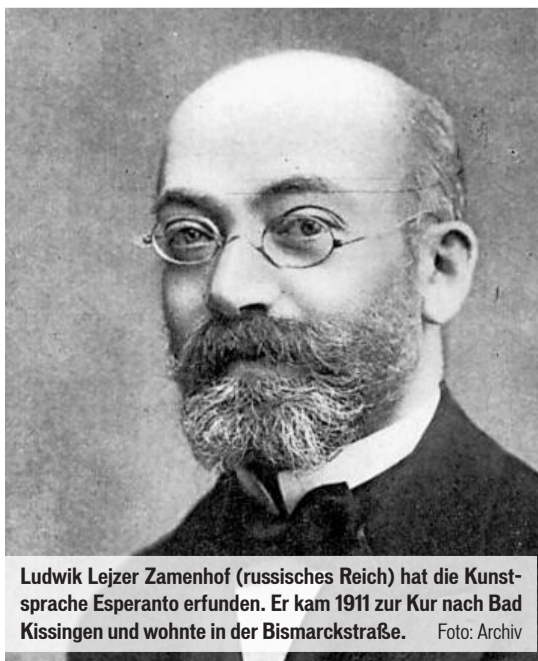
Ludwik Lejzer Zamenhof (russisches Reich) hat die Kunstsprache Esperanto erfunden. Er kam 1911 zur Kur nach Bad Kissingen und wohnte in der Bismarckstraße.