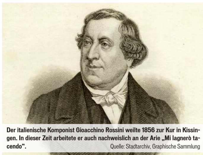
Der italienische Komponist Gioacchino Rossini weilte 1856 zur Kur in Kissingen. In dieser Zeit arbeitete er auch nachweislich an der Arie „Mi lagnerò tacendo“.