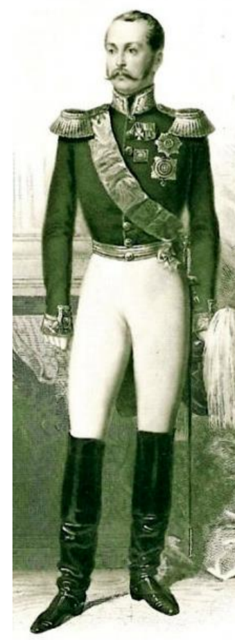
Zar Alexander II. v. Russland kurte bis 1868 drei Mal an der Saale.