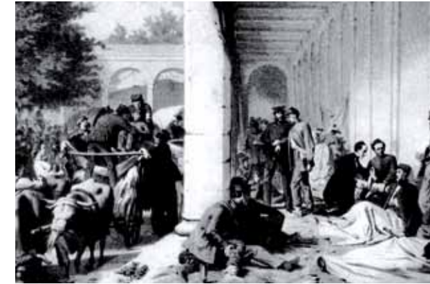
Arkadenbau 1866.

Noch heute wird der Rossini-Saal für kulturelle Veranstaltungen jeder Art, für Konzerte und Vorträge, für Tagungen und private Feiern genutzt. Seine insgesamt