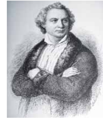
Friedrich von Gärtner Zeichnung (1882) von Albrecht Fürchtegott Schultheiss.

Am 11. Juli 1895 nahm bei einer Tanzveranstaltung im Conversationssaal die Louis-Stern-Affäre ihren Anfang, die sich bald zu einem über Monate dauernden diplomatischen Konflikt zwischen dem Königreich Bayern, dem Deutschen Kaiserreich und den Vereinigten Staaten ausweitete. Der damalige königliche Badkommissär (Kur-