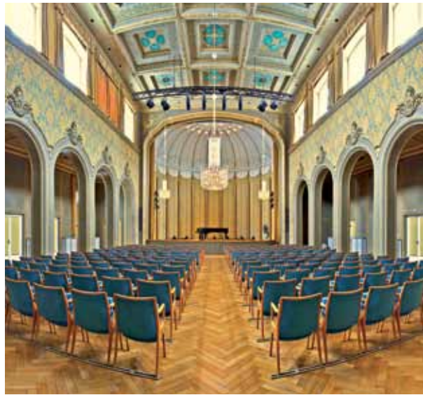
Rossini-Saal heute .