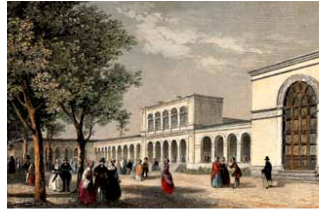
Arkadenbau um 1840.

In den Jahren 1910 bis 1913 ergänzte Architekt Max Littmann den Arkadenbau um weitere Bauten von der