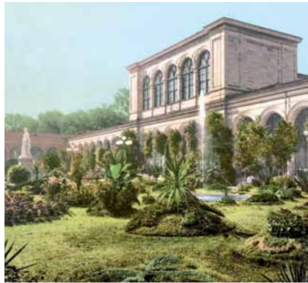
Arkadenbau um 1900.

In der Mitte der Arkaden steht der zweigeschossige Rossini-Saal, einst Conversationssaal und seit Eröffnung des Regentenbaus (1913) bis 2002 auch „Kleiner Kur-saal“ genannt. Er ist gestaltet mit einem in Längsrichtung beidseitig romanischen Rundbogengang und einer farbigen Kassettendecke. Fünf Achsen der Arkaden bilden zugleich die Vorhalle zum Saal, der 30 Meter lang, 20 Meter breit und 8,50 Meter hoch ist. Die Wände ließ Gärtner damals mit reichen Fresko-Malereien in byzantinischem Stil bemalen. Ursprünglich war der Saal leer, hatte keinen Bühnenraum und wurde nur nach jeweiligem Bedarf möbliert. Die Spiegel im Saal waren mit vergoldeten Ornamenten verziert, die Kamine aus Skyros-Marmor gefertigt und mit vergoldeten, schmiedeeisernen Gittern versehen. Im Obergeschoss waren die fünf Außenbogen zum Kurgarten hin zeitweilig verglast. Tagsüber diente der Saal den Kurgästen bei Schlechtwetter als Wandelhalle während des Heilwassertrinkens, abends als Veranstaltungssaal für Konzerte und Tanzveranstaltungen. Neben dem großen Saal gibt es noch heute einen kleinen Raum, einst gedacht für kleinere Stehempfänge oder als Eingangsfoyer zum Festsaal.