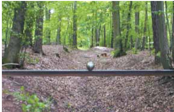
^ Sicher v Du