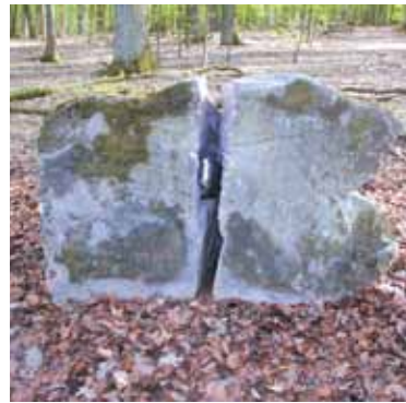
^ Kern v Mauern v Geborgen