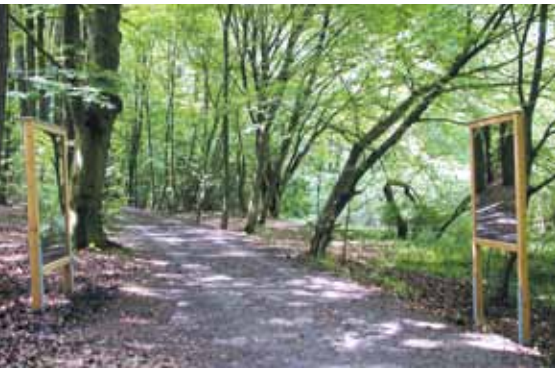
^ Spiegelbilder v Wie weit noch