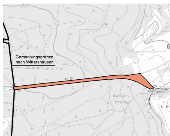
Änderungsbereich des Flächennutzungsplanes mit integriertem Landschaftsplan, Gemarkung Garitz

Im Rahmen der 21. Änderung wird der Flächennutzungsplan in folgenden Punkten geändert: